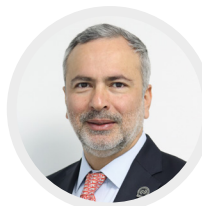
Mtro. Fausto Fortunato Barraza Arvizu Director General del Centro de Conciliación del Estado de Chihuahua.

Informe del segundo año de resultados 2023-2024 del Centro de Conciliación Laboral del Estado de Chihuahua a cargo del: